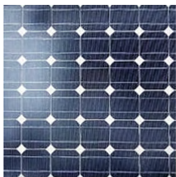
Krystallinsk silicium (mono, poly)

Man skelner normalt mellem de to mest almindelige kategorier af solcelleteknologier, som er: