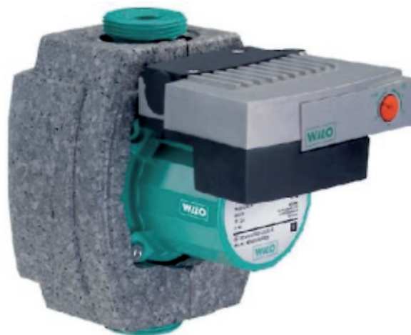
Pumpe med isoleringskappe