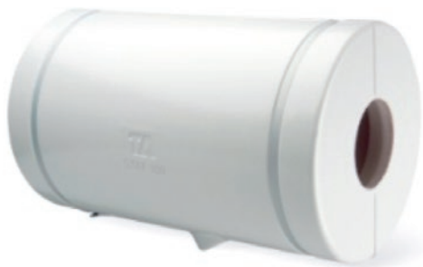
Rørskål afsluttet med plastkappe

Hvis der ikke findes isoleringskapper til de pågældende ventiler og pumper, kan isoleringen udføres med lamelmåtter og pladekapper.